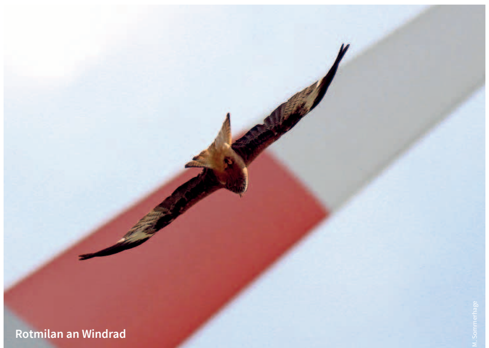
Rotmilan an Windrad