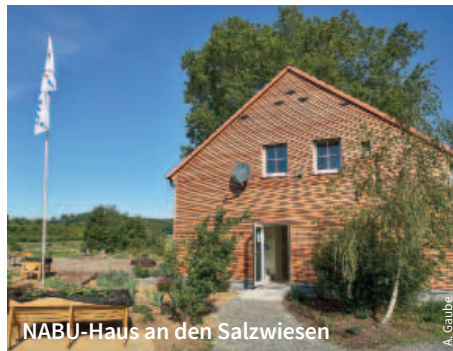
NABU-Haus an den Salzwiesen