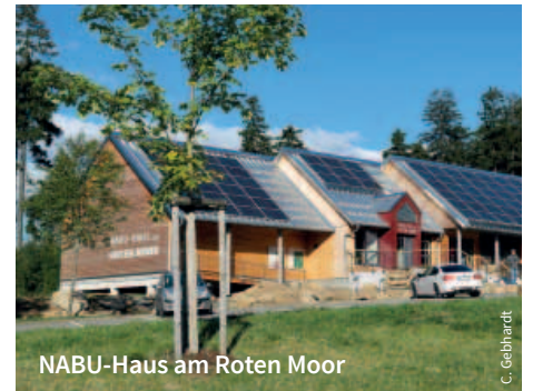
NABU-Haus am Roten Moor