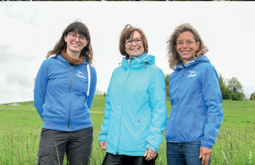
B. Peiff shutterstock/peiff